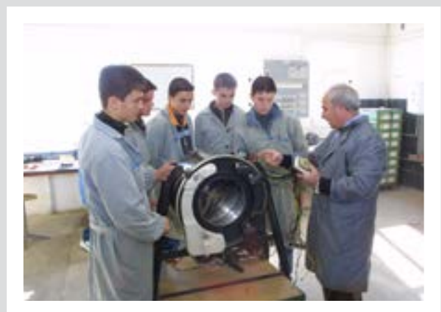
1993 engagiert sich Swisscontact in Albanien zum ersten Mal im postkommunistischen Osteuropa.