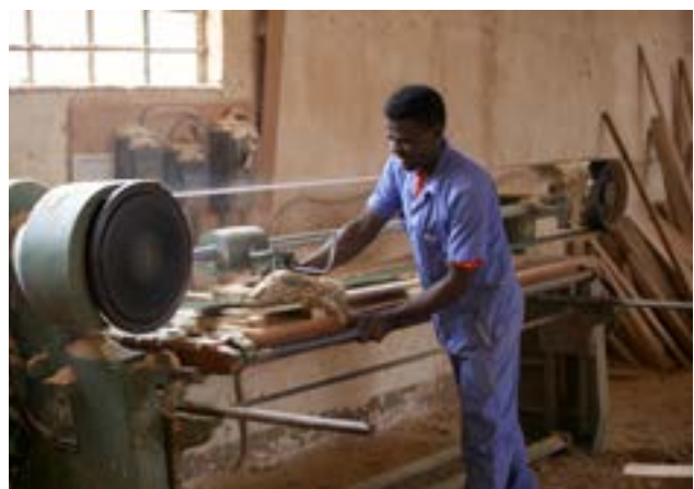
Berufsbildung in DR Kongo

So bleibt die Organisation Swisscontact fit für die kommenden Herausforderungen und wir können unseren Stiftungszweck auch in Zukunft verlässlich und qualitativ hochstehend erfüllen.