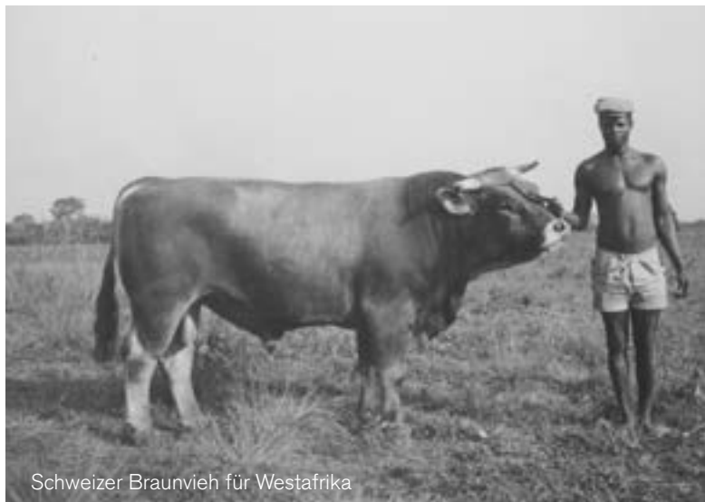
Schweizer Braunvieh für Westafrika

DIE PROJEKTARBEIT VON SWISSCONTACT HAT SICH IN DEN LETZTEN 60 JAHREN GEWANDELT. ZU BEGINN WAR WISSEN AUS DER SCHWEIZ TRANSFERIERT WORDEN, DANN GING DIE STIFTUNG DAZU ÜBER, GEZIELT LOCALE RESSOURCEN ZU STÄRKEN UND ZU NUTZEN. DAS WIRD DEUTLICH, WENN DIE ARBEIT AUS DER ANFANGSZEIT MIT AKTUELLEN PROJEKTEN VERGlichen WIRD. DER GRUNDSATZ, DER DEN ERFOLG VON SWISSCONTACT AUSMACHT, GILT ABER NACH WIE VOR: DIE PROJEKTE SIND STETS AUF DIE BEDÜRFNISSE DER LOCALEN MÄRKTE AUSGERICHTET.