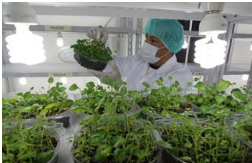
Förderung von Kleinunternehmen in agroindustriellen Wertschöpfungsketten, Honduras