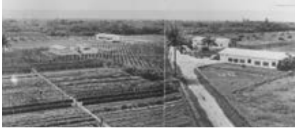
1963 - In Sékou (Dahomey, heute Benin) nimmt eine Landwirtschaftsschule als zweites Projekt von Swisscontact den Betrieb auf.