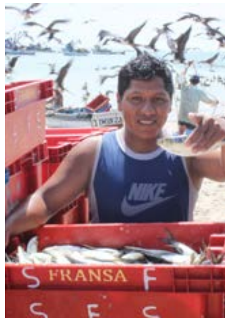
Unterstützung von Fischereiverbänden in Peru

Später folgen vergleichbare Projekte in Bolivien, Peru, Indonesien und Vietnam.