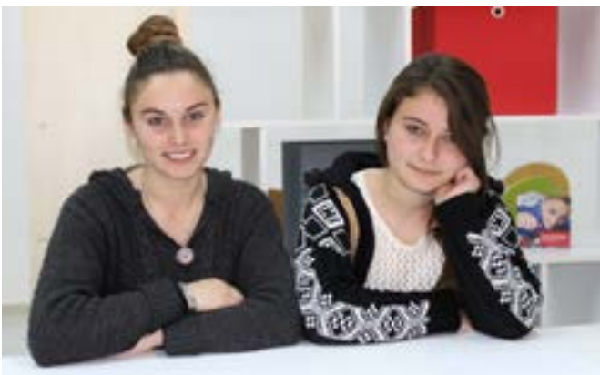
Berufsschülerinnen in Albanien