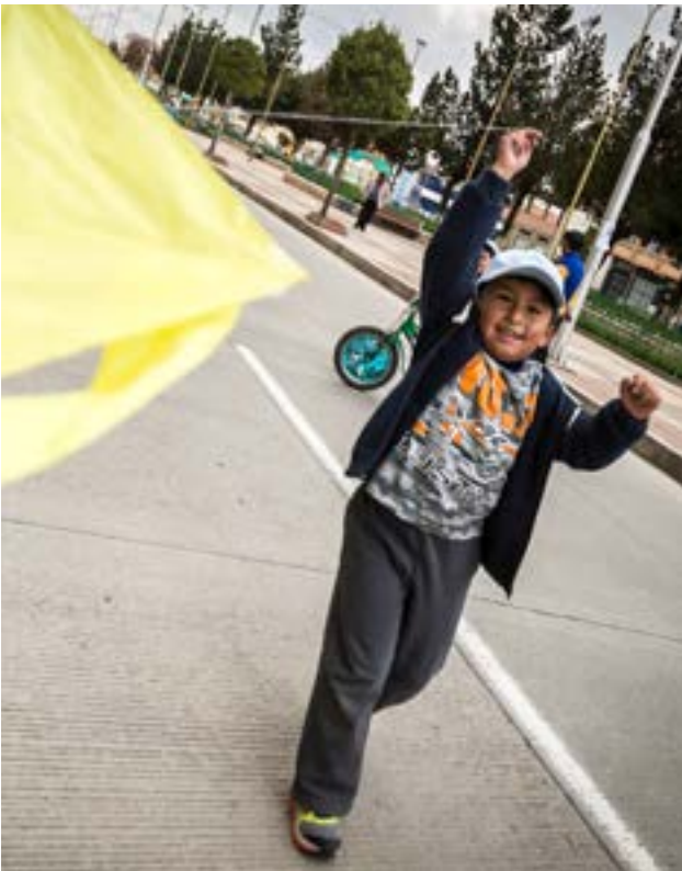
‘Saubere Luft’ für Bolivien

Die positiven Ergebnisse der letzten Jahre zeigen, dass wir im Jahr 2012 mit unserer Strategie 2020 die richtigen Entscheidungen getroffen haben und im Entwicklungsmarkt gut positioniert sind. Wir geniessen das Vertrauen unserer Spender und Partner. Dennoch arbeiten wir in einem sich schnell verändernden Umfeld, das mit erheblichen Risiken behaftet ist. Entwicklungsarbeit findet in volatilen und fragilen politischen und wirtschaftlichen Systemen statt. Das bedeutet, dass wir bei all unseren Bemühungen flexibel bleiben müssen.