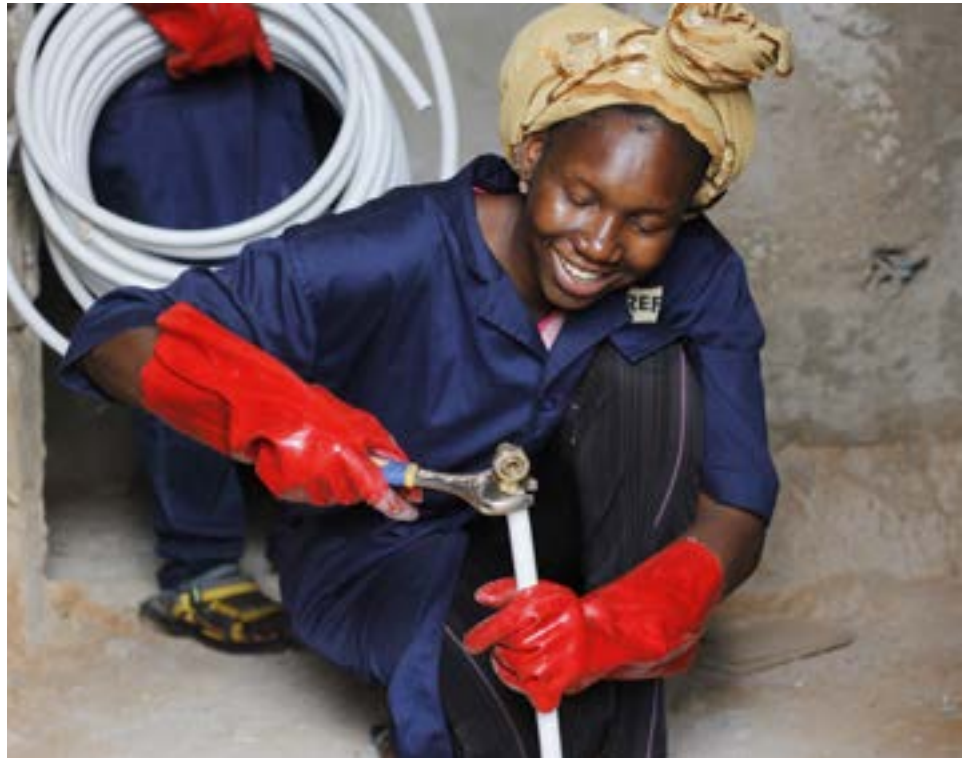
Berufsbildung zur Sanitärin in Mali