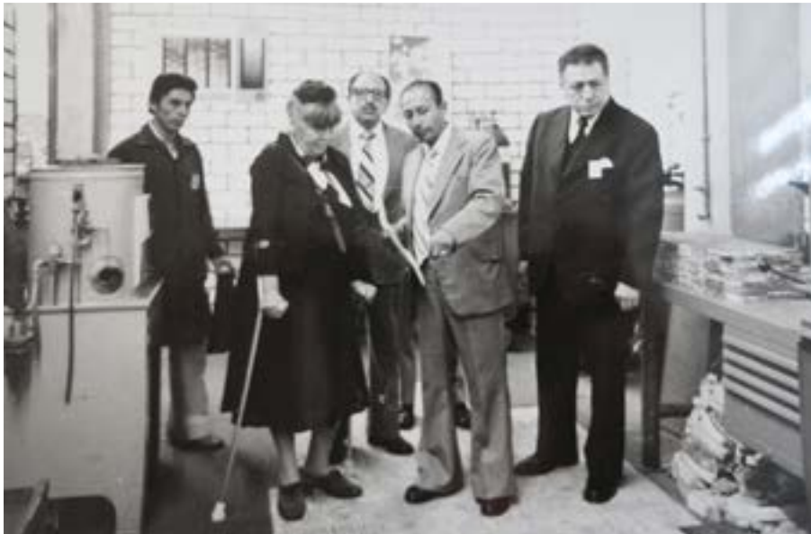
Swisscontact ist seit 1966 in Peru tätig. Peru ist das erste Land, in dem Swisscontact seit 50 Jahren ohne Unterbruch Entwicklungsprojekte durchführt.