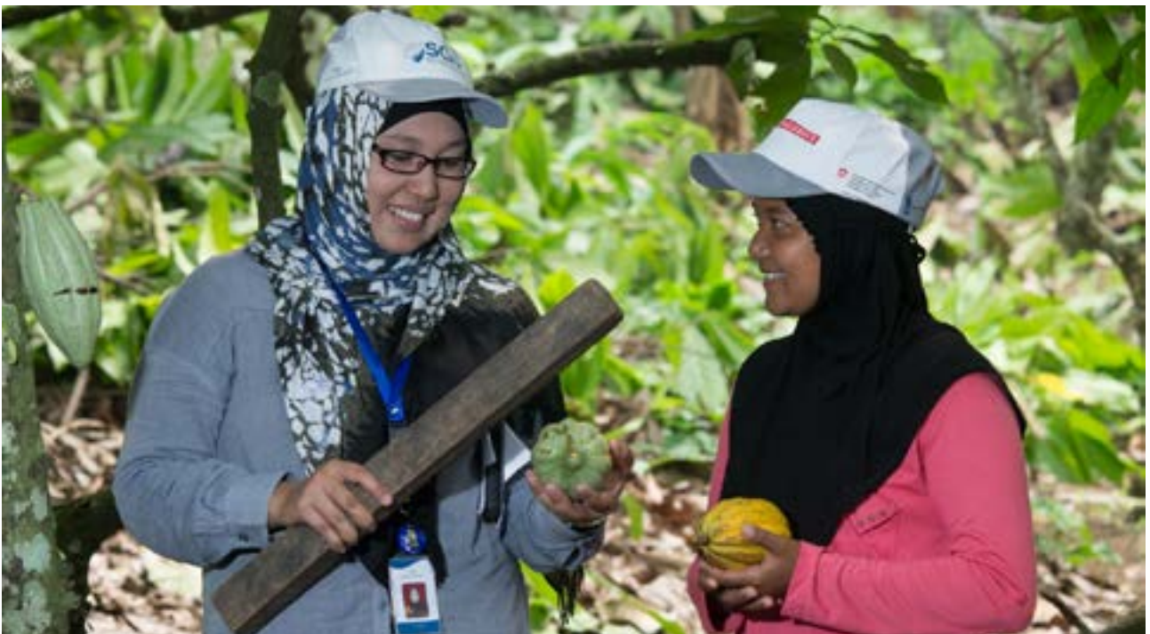
Kakaobäuerinnen in Indonesien

ENTWICKLUNG SETZT WANDEL VORAUS. DAS ZEIGT DIE GESCHICHTE VON SWISSCONTACT: SEIT DER GRÜNDUNG 1959 HAT SICH DIE ARBEITSWEISE VERÄNDERT, NEUE THEMENSCHWERPUNKTE UND PARTNERLÄNDER SIND HINZUGEKOMMEN. AM ZIEL HAT SICH JEDOCH IN DEN 60 JAHREN NICHTS VERÄNDERT: SWISSCONTACT SCHAFFT MÖGLICHKEITEN FÜR MENSCHEN, SICH WIRTSCHAFTLICH ZU ENTWICKELN UND DER ARMUT AUS EIGENER KRAFT ZU ENTKOMMEN.