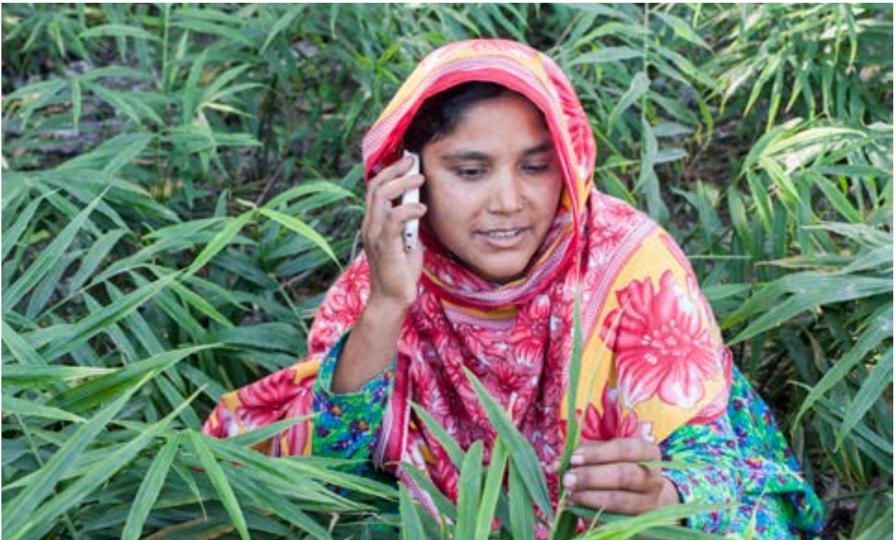
Kleinbäuerin in Bangladesch profitiert von der Help-Line

Und noch etwas zeigen die Beispiele: Die Arbeit von Swisscontact ist nachhaltig. An den Schulen in Chandigarh und Benin werden bis heute Fachkräfte ausgebildet.