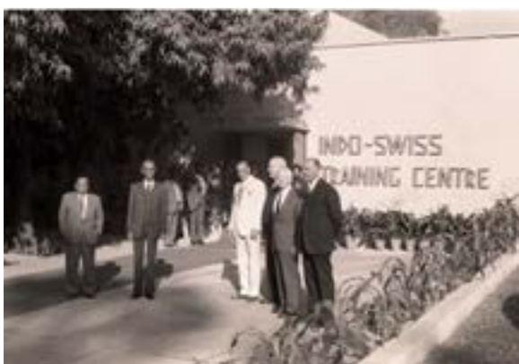
1987 - Feier zum 25-Jahre-Jubiläum am Indo-Swiss Training Center in Chandigarh.